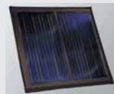
Vitosol 200-F ravni kolektor, velike površine 4,76 m 2 apsorbnog površine